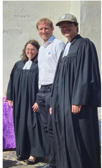
Text und Fotos: André Flimm